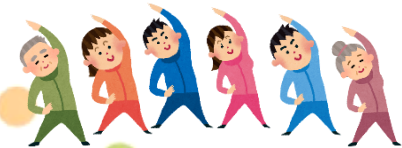
フレイル 予防講座

高齢者あんしん相談センター大横では平日毎日行っている「おおよこ毎日体操」やフレイル予防講座を開催します。